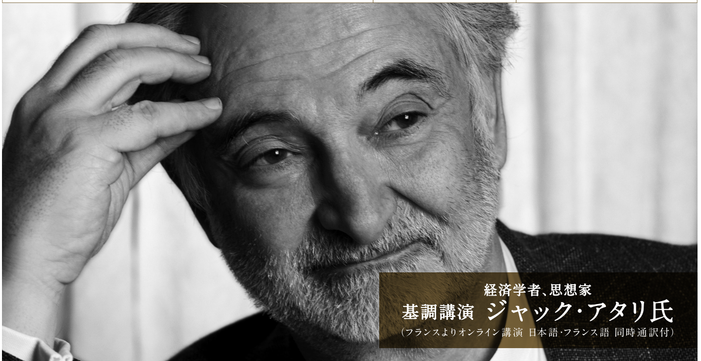
経済学者、思想家 基調講演 ジャック・アタリ氏 (フランスよりオンライン講演 日本語・フランス語 同時通訳付)